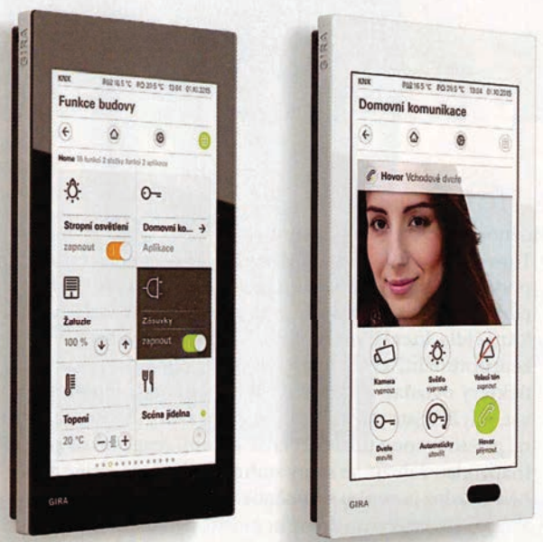
Nová Gira G1 je inteligentní dotykový panel pro řízení všech technologií budovy. Lze jím ovládat mnoho funkcí, od osvětlení, žaluzií, nastavení teploty v místnosti, on-line předpovědi počasí až k domovní komunikaci, cena 28 440 Kč (SBS Elektro).

Dotykové displeje i počítač komunikují s řídicí jednotkou prostřednictvím počítačové sítě (LAN, WAN i Wi-Fi) nebo speciální sběrnice, mobily a tablety pak díky Wi-Fi nebo běžným datovým službám operátora. Z jakéhokoli místa. Dům můžete mít třeba v Brně a zkontrolujete si ho, když jste s rodinou na dovolené na druhé straně zeměkoule. Řídicí systémy jsou většinou připojené k internetu, což nabízí další zajímavé možnosti. Některé jsou dokonce schopné využívat internet pro získávání různých dat, jako například předpovědi počasí, přehled o aktuální dopravní situaci na vaší cestě do práce (než vyrazíte z domu) nebo třeba i jídelního lístku oblíbené restaurace a podobně.