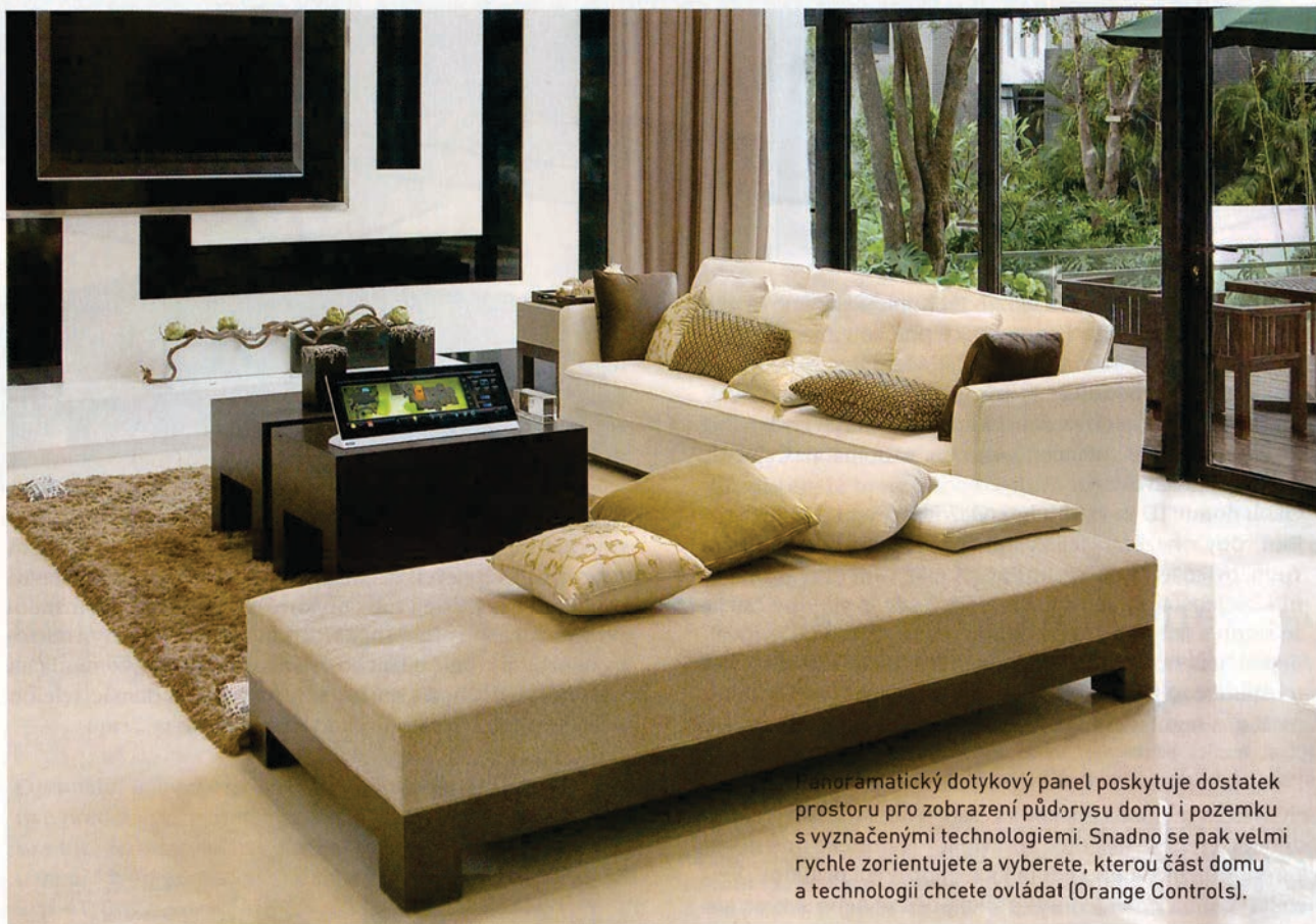
Panoramatický dotykový panel poskytuje dostatek prostoru pro zobrazení půdorysu domu i pozemku s vyznačenými technologiemi. Snadno se pak velmi rychle zorientujete a vyberete, kterou část domu a technologii chcete ovládat (Orange Controls).

Praktickou službou je možnost napojení ID na centrální monitorovací software firmy, která ho instalovala. Pokud by hrozil případný výpadek systému nebo porucha některé z technologií, vás na to upozorní.